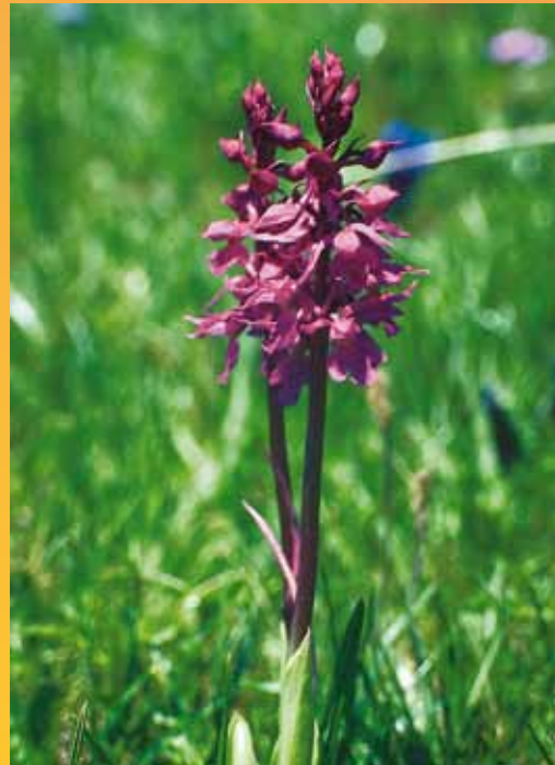
Holunderknabenkraut « Dactylorhiza Sambucina »