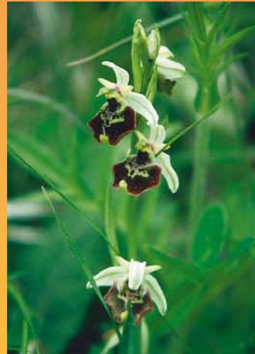
Hummelragwurz « Ophrys Sphecodes »