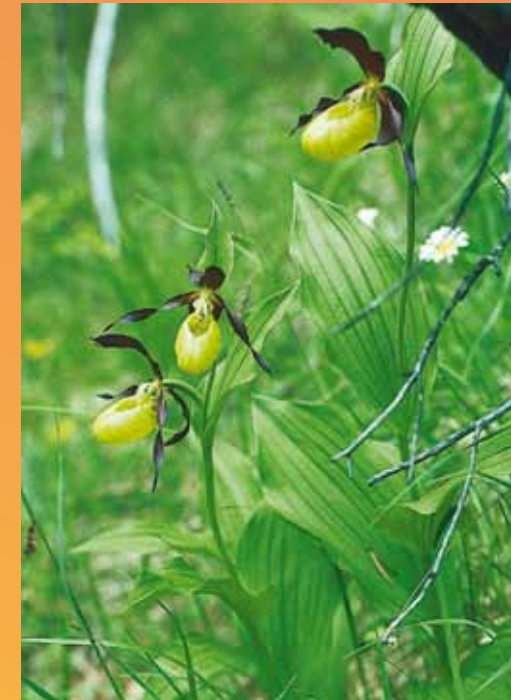
Frauenschuh « Cypripedium Calceolus »